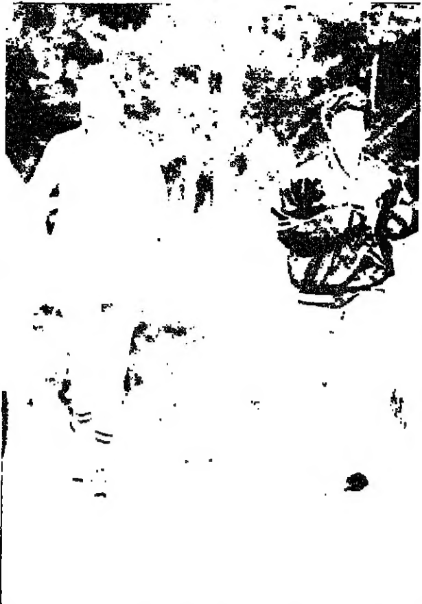
على سلاح المني ميتا امس الاول بعد محاولته الاقتراب من البركان الثائر لمشاهدة الحمم عن كثب. كتانيا (ايطاليا) - ا ف ب